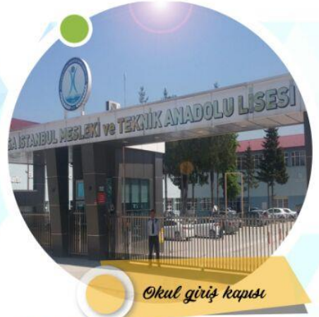
Okul giriş kapısı