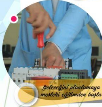
Geleceğini planlamaya mesleki eğitimden başla